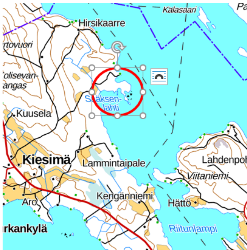
Kuva 1: Kaavamutosalueen sijainti (punainen ympyrä/soikio).

Rantaosayleiskaavan muutos koskee tilaa 686-409-12-40 ja yhteistä vesialuetta 686-409-876-1.